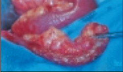
So sieht der Wurmfortsatz aus.

Fälschlicherweise spricht man von Blinddarmoperationen, obwohl nur der Wurmfortsatz entfernt wird.